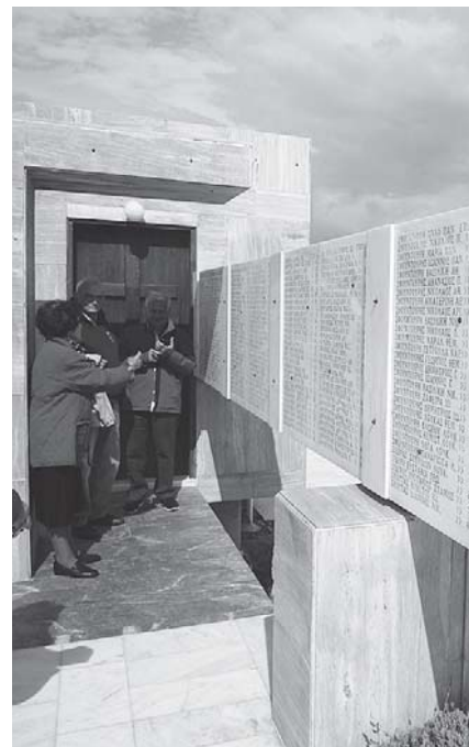
Στο Ηρώο σφαγιασθέντων (1944) στο Δίστομο

Στη συνέχεια ανεβήκαμε σε υψόμετρο 1.000 μέτρων περίπου, στην Αρβανίτσα, ένα καταπράσινο οροπέδιο με έλματα, όπου γευματίσαμε. Η συμμετοχή των συναδέλφων - μελών ήταν σημαντική και θέλουμε να ελπίζουμε ότι οι εξορμήσεις μας θα συνεχιστούν και θα προσπαθήσουμε να επεκταθούν και σε άλλες περιοχές της Ελλάδας.