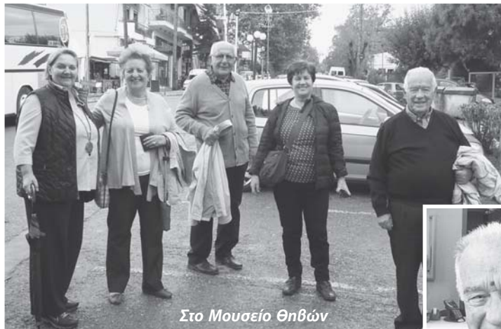
Στο Μουσείο Θηβών

Στις 13 Οκτωβρίου πραγματοποιήθηκε η πρώτη εκδρομή του Συλλόγου μας, όπως είχε οργανωθεί. Επισκεφτήκαμε το καινούργιο Μουσείο των Θηβών, στο οποίο μας έγινε ξενάγηση με έξοδα του Συλλόγου μας (222 €). Ακολούθησε προσκύνημα στο Ηρώο των Σφαγιασθέντων το 1944 στο Δίστομο και στη συνέχεια επισκεφτήκαμε την Ιερά Μονή Οσίου Λουκά.