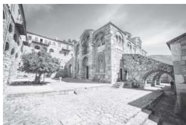
Στην Ιερά Μονή Οσίου Λουκά

Στη συνέχεια ανεβήκαμε σε υψόμετρο 1.000 μέτρων περίπου, στην Αρβανίτσα, ένα καταπράσινο οροπέδιο με έλματα, όπου γευματίσαμε. Η συμμετοχή των συναδέλφων - μελών ήταν σημαντική και θέλουμε να ελπίζουμε ότι οι εξορμήσεις μας θα συνεχιστούν και θα προσπαθήσουμε να επεκταθούν και σε άλλες περιοχές της Ελλάδας.