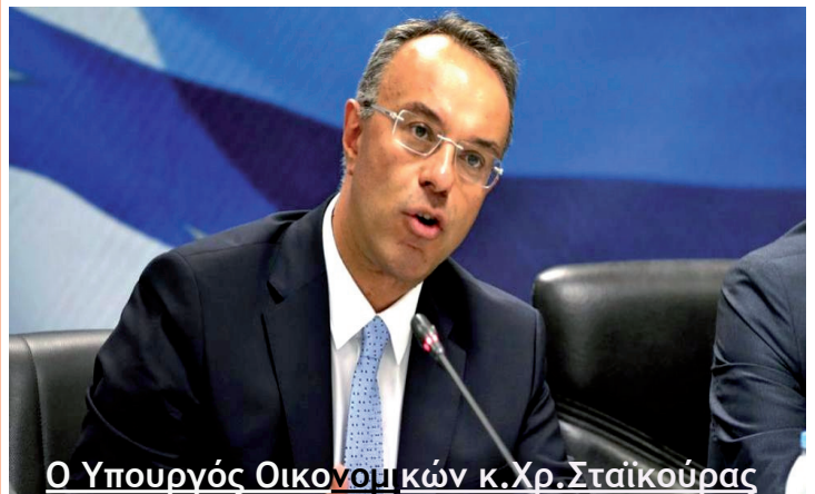
Ο Υπουργός Οικονομικών κ.Χρ.Σταϊκούρας

Σας θυμίζουμε ότι, τα αντίστοιχα αναδρομικά των ίδιων νόμων 4051 & 4093/12, των Ειδικών Μισθολογίων για όλο το διάστημα (όχι μόνο το 11μηνο) φορολογήθηκαν σύμφωνα με τον Ν. 4472/17 με αυτοτελή φορολογικό συντελεστή 20% και εκεί τελείωσε κάθε άλλη φορολογική υποχρέωση των δικαιούχων.